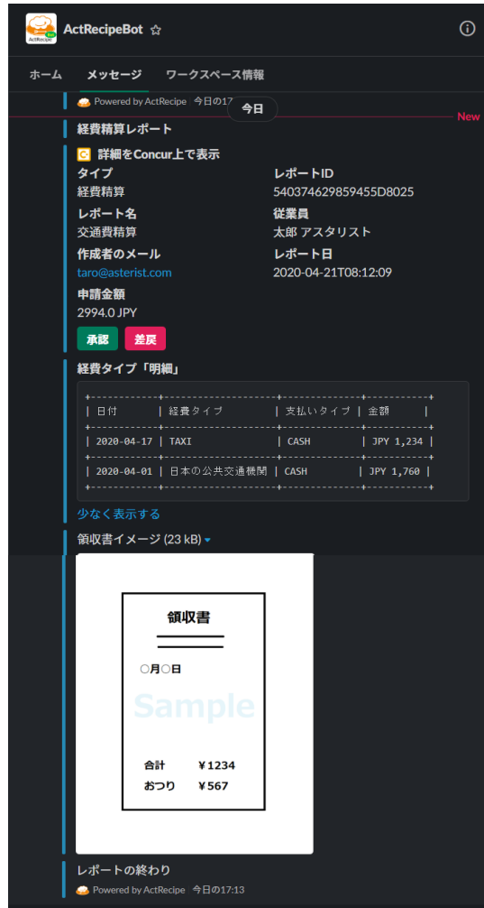
<Slack 上での Concur Expense の承認イメージ>

Concur Expense の承認依頼を Slack へ通知するために、アスタリストでは「ActRecipeBot」という Slack 用アプリケーションを開発しました。ActRecipeBot は、通知を受け取るだけでなく Slack の画面上で経費精算の承認や差戻を可能にしているため、承認者は Concur Expense へログインをすることなく素早く承認や却下の判断を行うことができます。